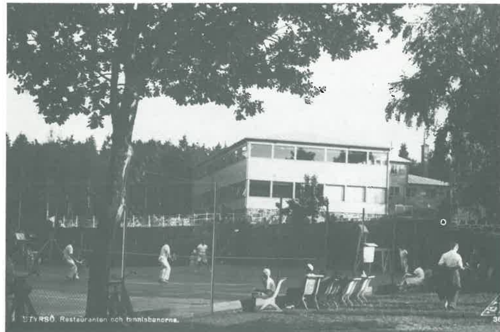
Tennismatch i slutet av 1940-talet (ev. i början av 50-talet).

Åren går. Om 1940-talet har jag intet källmaterial, men man får förmoda, att aktiviteten var oförändrat stor även då, om inte annat för att skingra tankarna på det då rådande världskriget.