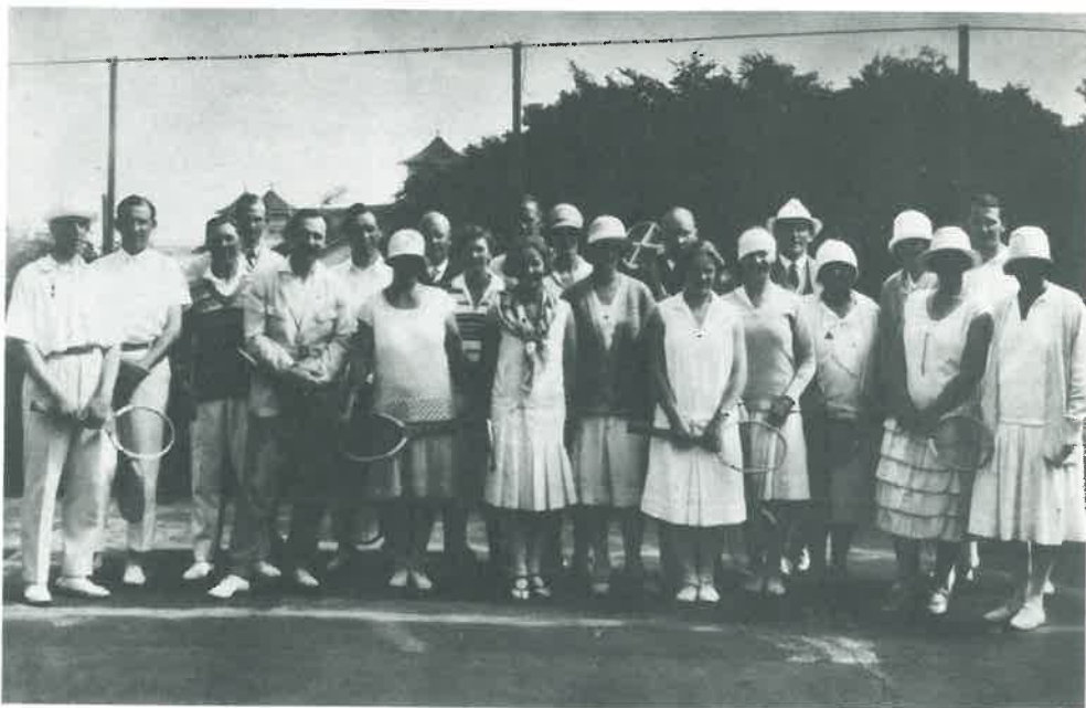
Deltagarna i tennisdrammen mellan Brottkärr och Styrö 12/8 1928 å Styrö tennisbanor.