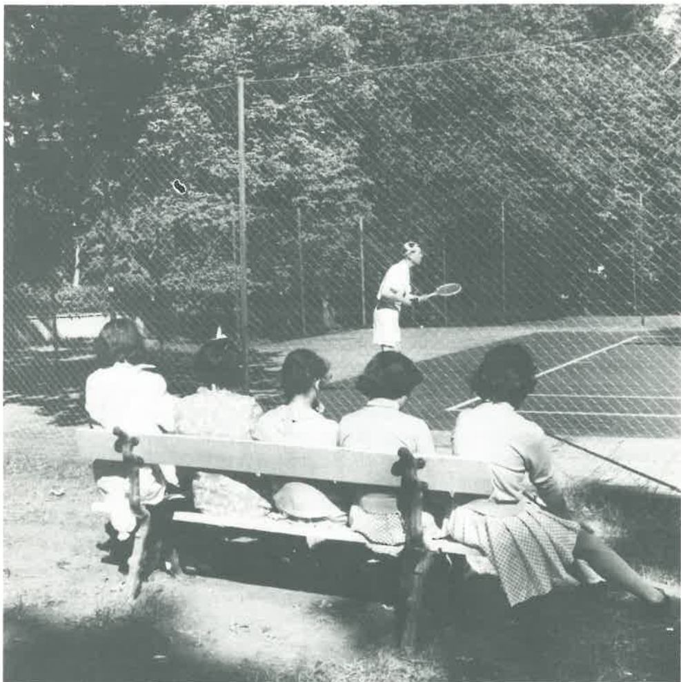
Legendariske Sture Tingström med beundrarinnor, 1950.